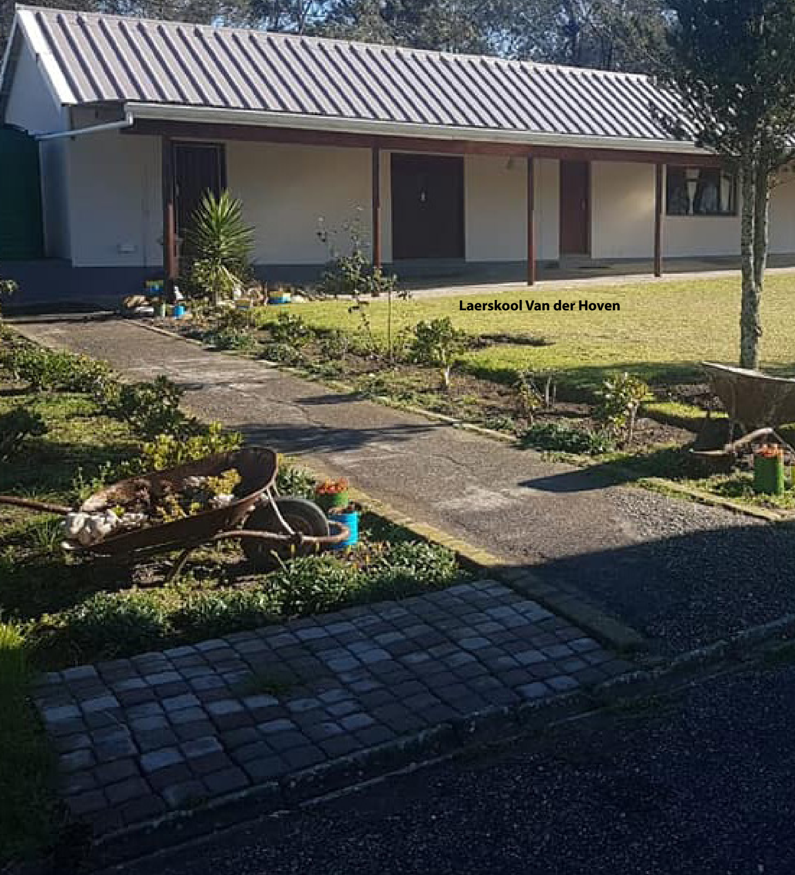
Laerskool Van der Hoven