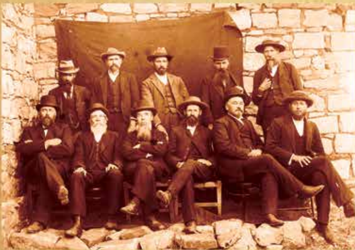
Die Kerkraad van Trichardtsfontein in 1904 op Holfontein, Distrik Bethal.

Ouderlinge het toegesien dat op Sondag byeengekom is om kerk te hou, en het dikwels uit 'n preekbundel voorgelees. Hulle het ook begrafnisse waargeneem. In talle gemeentes is die volledige kategese tot by aflegging van geloofsbelydenis aan ouderlinge opgedra, met die gevolg dat hulle lidmate geword het sonder dat hulle ooit deur 'n predikant gekatkiester is. Met huisbesoek het hulle lidmate aangespoor om erns te maak met die daaglikse Boekevat.